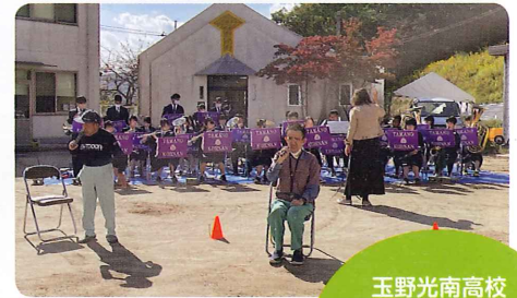
玉野光南高校吹奏楽部の方が 観て楽しめるDVDを 作ってくれました。