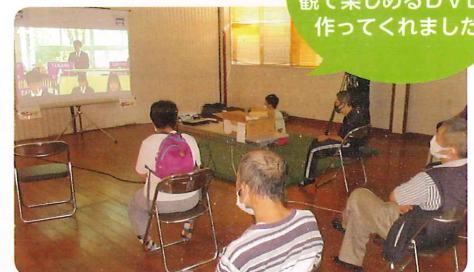
コロナ禍での交流・演奏会のDVD上映会