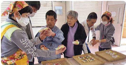
園内で社会見学。のぞみ科学館とおみやげ屋さんを開催