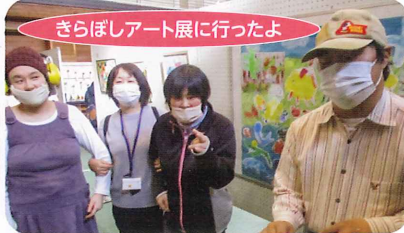
きらぼしアート展に行ったよ