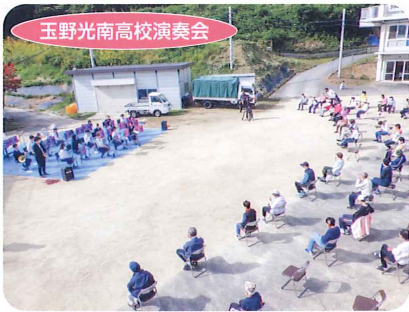
玉野光南高校演奏会