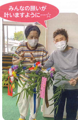
みんなの願いが 叶いますように…☆