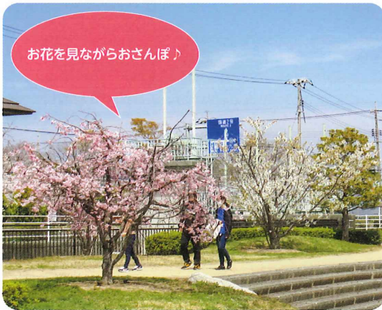
お花を見ながらおさんぽ♪

生活介護事業所「エスポアール・クワノ」は、利用者23名で明るく・楽しく元気いっぱい活動しています。