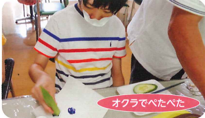
オクラでぺたぺた

8月には、二つのグループが合同で、エスポで育てた野菜をスタンプにして作品を作りました。「動物を描こう」というテーマで合作し、「第6回きらぼし★アート展」に応募したところ、入選。サンワーク総社やきらぼしアートセンターに展示されました。健康に気をつけて、日々の作業や活動も頑張っています。