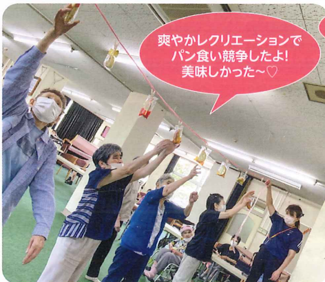
爽やかレクリエーションで パン食い競争したよ! 美味しかった〜♡

個々で作品作りをしたり、今年度は、地元の洋品店協力の元、訪問販売を行い、コロナ禍で外出できない利用者の方が、自分で洋服を選んで買い物する楽しさを味わってもらえるようにしています。少しでも充実した生活が送れるように取り組んで参ります。