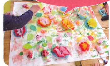
春のへきはお花がいっぱい えの具・がようし・お花紙・ビニール袋 いろんな素材で創作☆

日々の活動や季節ごとの催し物、そして人と人とのつながりを通して、毎日の生活がより充実したものになるよう取り組んでいます。