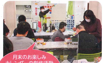
月末のお楽しみ カレンダーの創作活動 すてきなカレンダーを つくるぞ〜☆