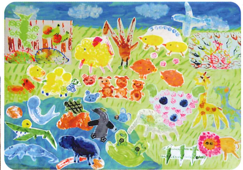
入選作品「ようこそサファリパークへ」